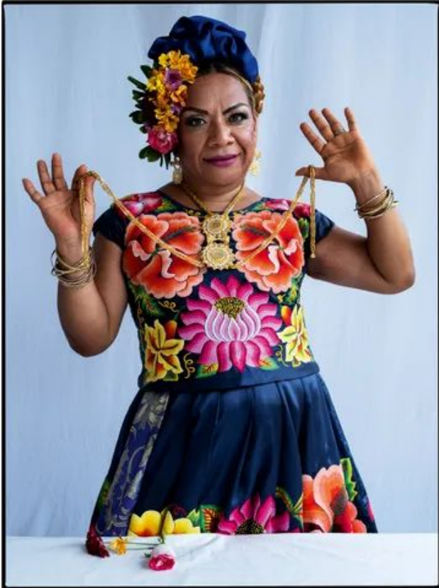
© Fotografía: Tim Walker// Realización: Kate Phelan

"Hay hombres y mujeres y hay algo en medio. Y eso es lo que soy."